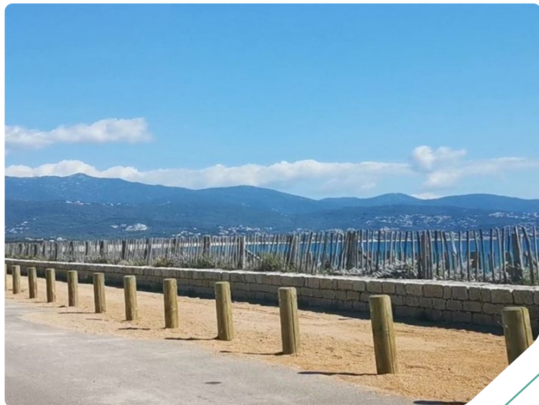
Borne RICANTO – Littoral Corse