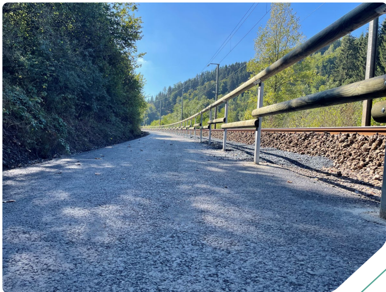
Modèle CADIZ - Luxembourg

Équilibre | Sécurité | Engagement Pour nous, votre projet est unique.