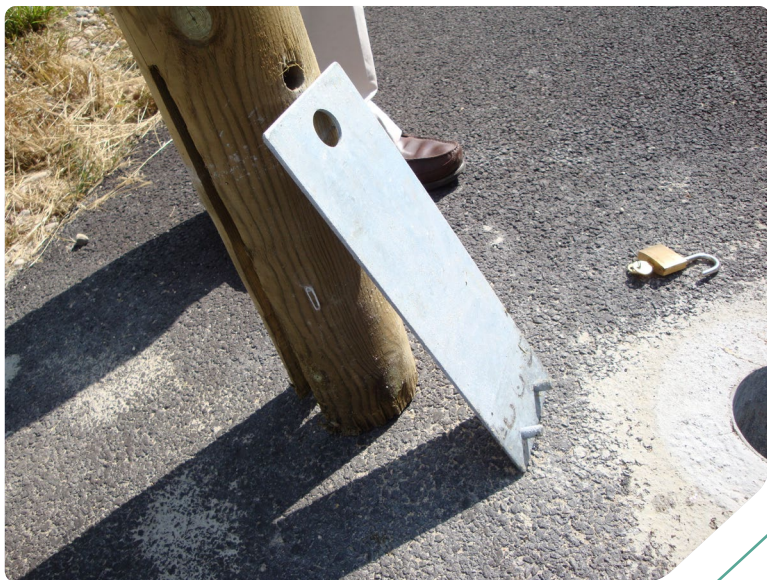
Borne à embase amovible