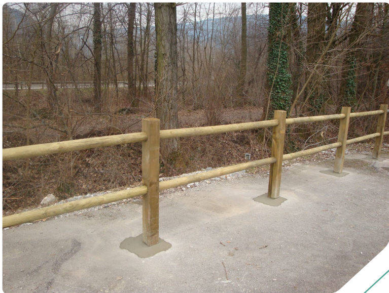
TREVI supports carrés en bois massif autoclavé