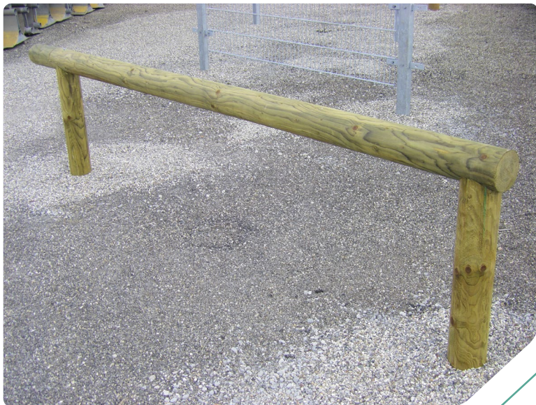
Clôture London – détail de l'usinage gueule de loup